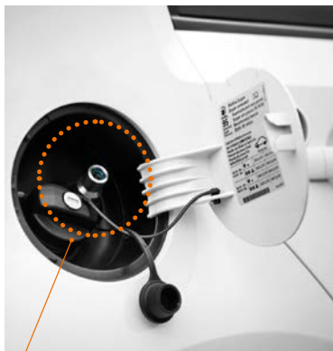
Toma de carga del vehículo