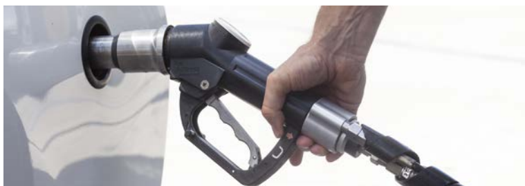
Manguera tipo pistola