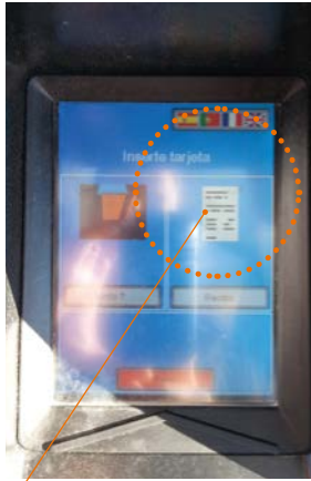
Solicitud de recibo

> Si deseamos recibo del repostado, volvemos a introducir la tarjeta en el módulo de pago o pulsamos el botón de recibo especificando el surtidor de repostaje.