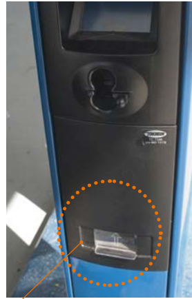
Entrega de recibo