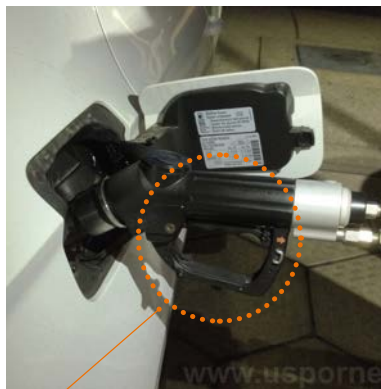
Pistola alineada y gatillo presionado