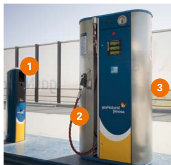
Estación sin cierre